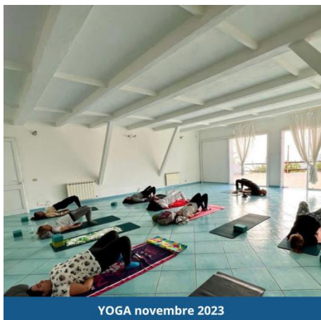
YOGA novembre 2023