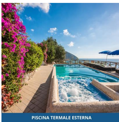
PISCINA TERMALE ESTERNA